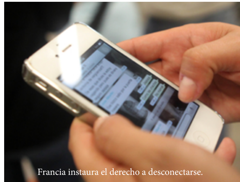
Francia instauro el derecho a desconectarse.